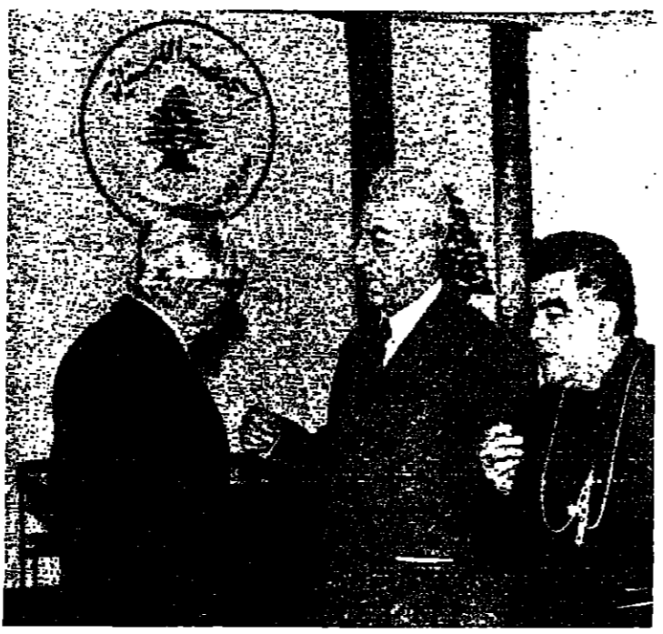
الرئيس شمعون في حديث مع الدكتور شارل مالك والابني شربل قسيس . حيث على الماشي بين الرئيس فرنجي والابني قسيس .